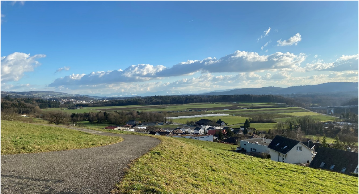
Ausgangszustand (Blick aus Westen) entspricht der Endgestaltung

Im Kanton Aargau wird viel gebaut. Mit der Richtplanfestsetzung soll für die nächsten 15 bis 20 Jahre die regionale Versorgung mit Kies sowie ein regionales Auffüllvolumen für unverschmutzten Aushub sichergestellt werden. Der Bedarf ist aus kantonaler Sicht gegeben und das Vorhaben wird durch den Kanton unterstützt. Nach 25 Jahren Abbau, Wiederauffüllung und Rekultivierung kann das Gebiet wieder landwirtschaftlich genutzt werden.